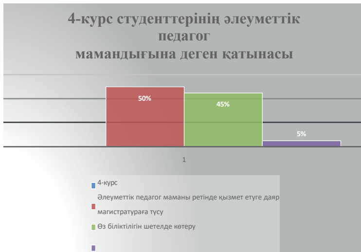
2-сурет – 4-курс студенттерінің әлеуметтік педагог мамандығына деген қатынасы

педагог ретінде қызмет еткісі келетіндігін айтса, 20% әлеуметтік педагог, әрі «Өзін-өзі тану» пәнінің мұғалімі ретінде еңбектенуді айтса, 25% магистратурада өз білімдерін жалғастыруды ойластыруда, қалған 20% нақты бұл мамандыққа деген жоспарының айқын еместігін білдірді.