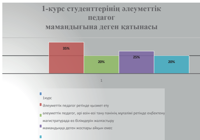
1-сурет – 1-курс студенттерінің әлеуметтік педагог мамандығына деген қатынасы