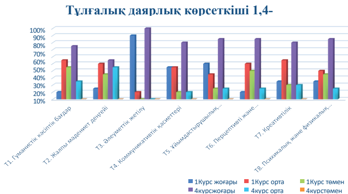
3-сурет – 1,4-курс студенттерінің тұлғалық даярлық көрсеткіші

Келесі кезекте Ю.А.Гончарованың «Әлеуметтік педагогтың кәсіби іс-әрекетке даярлығын анықтау әдістемесі» жүргізілді.