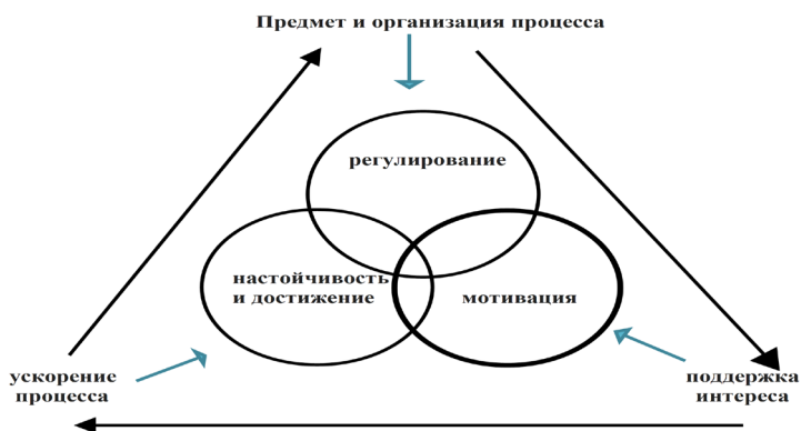
Рис.1 – Типы мотиваций успешной деятельности в Цифровой Истории (Fig.1 – Types of Motivations for Successful Activity in Digital History)

Современные исследования мотивационных факторов основываются на теории самодетерминации и проведенные серии экспериментов отражают типы мотиваций на материалах учебной деятельности школьников.