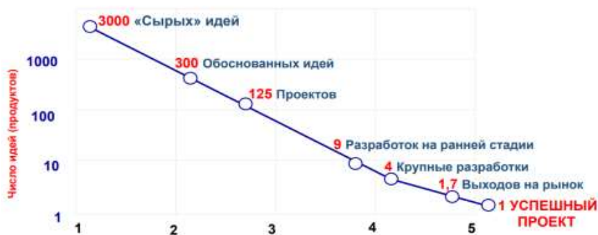
рисунок 6 – Количество успешных проектов коммерциализации

В 2021 году благодаря описанному взаимодействию были профинансированы 9 проектов: из них 6 проектов выиграли гранты и 3 привлекли инвестиции.