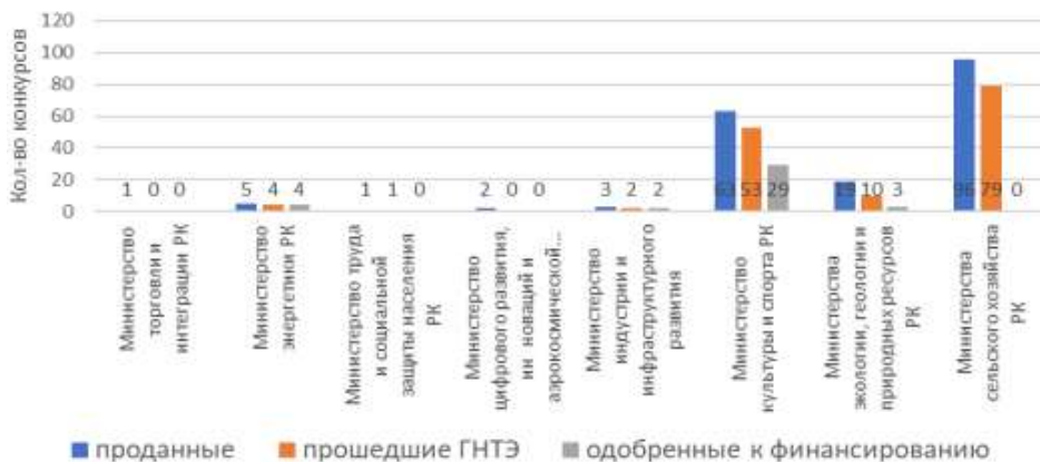
рисунок 2 – Количество конкурсов программно-целевого финансирования в Казахстане, срок реализации которых 2021–2023 годы

По грантовому финансированию одобрены конкурсы организованные: