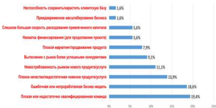
рисунок 3 – Проблемы коммерциализации стартапов

АО «Фонд науки» провел опрос ученых на их потребности в области коммерциализации, после чего было выявлено, что: