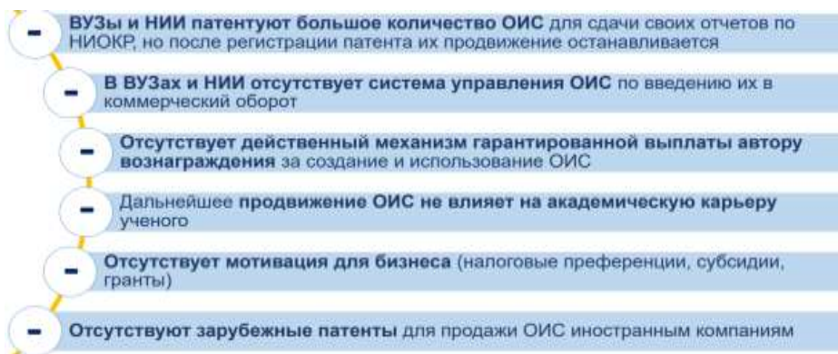
рисунок 4 – Проблемы лицензирования проектов

Вузы также участвуют в процессе разработки и лицензировании проектов. Основные проблемы лицензирования проектов показаны на рисунке 4.