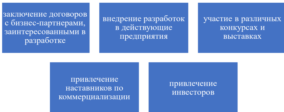
рисунок 5 – Пути увеличения доли коммерциализации интеллектуальной собственности

Также АО «Фонд науки» разработал бизнес-модель по установлению связей между бизнесом и наукой, которая включает три направления: