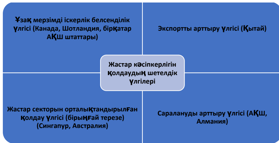
Сурет 1 – Жастар кәсіпкерлігін қолдаудың шетелдік үлгілері(Chigunta, 2002 )

Кейбір елдер өздерінің күш-жігерін нақты тұжырымдамаларға емес, бүкіл елге немесе аймаққа тән мәселелерге бағыттауды жөн көруі мүмкін.