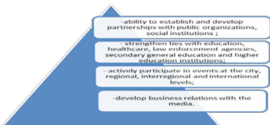
Figure 3-Social competence

We also assess the ownership of managerial culture by differentiating it into levels, taking into account the set one-time or prospective tasks.