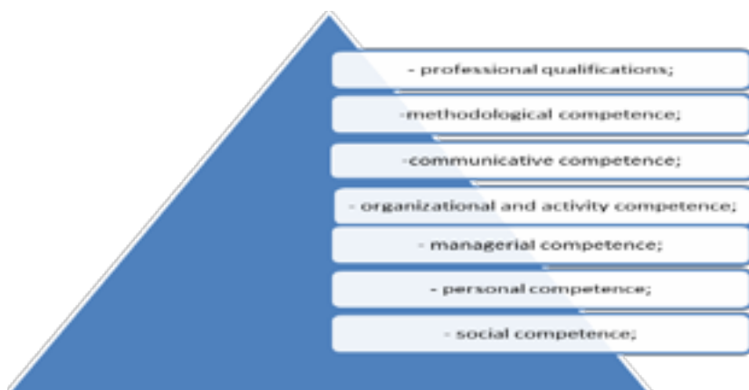
Figure 1-Professional competence

The managerial culture of a manager presupposes: the manager's possession of relevant knowledge that reveals the content of managerial functions, managerial communication, theories of employee motivation, as well as compliance with the requirements for the personal characteristics of the manager as a leader: his individual abilities and talents, professional competencies.