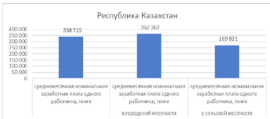
Рис. 4 Среднемесячная заработная плата работников в разрезе городской и сельской местности за 2022 год

Исходя из предоставленных данных о среднемесячной заработной плате работников по регионам в разрезе городской и сельской местности, можно сделать следующие выводы: