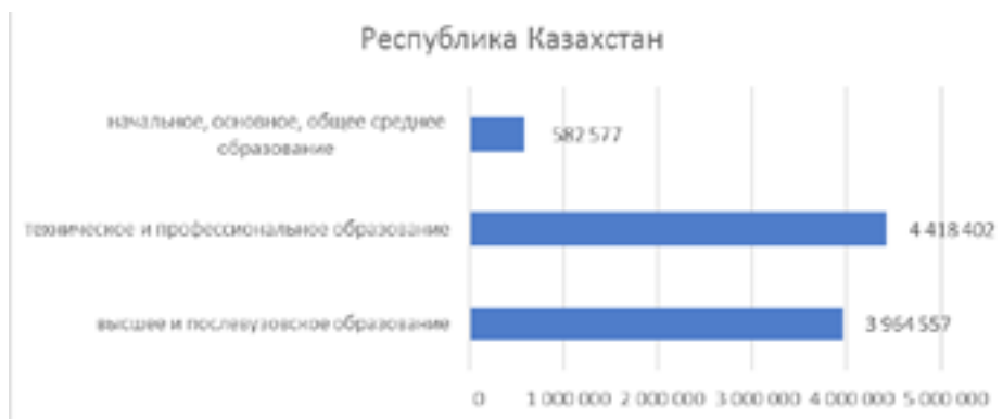
Рис. 3. Население имеющие образование за 2022 год

Исходя из предоставленных данных о распределении занятости населения Республики Казахстан по уровню образования, можно сделать следующие выводы: