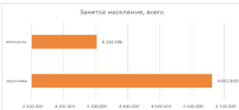
Рисунок 1 - уровень занятости за 2022 г.

Занятое население по статусу занятости составляет 8965536 человек рисунок 1.