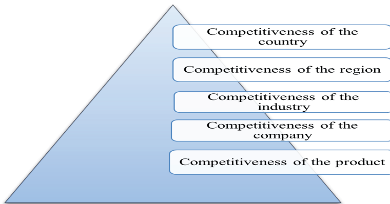
Figure 1 - The pyramid of competitiveness

In economic theory, it is customary to consider competitiveness at different levels: at the level of an enterprise, industry, region and country as a whole (Figure 1). Let's look at each of the types of competitiveness in detail.