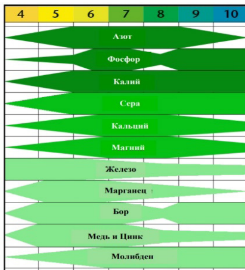
Рисунок 1. Доступность элементов растениями в зависимости от изменения уровня pH

В щелочных средах содержание молибдена (Mo) и макроэлементов (кроме фосфора) увеличивается, а содержание фосфора (P), железа (Fe), марганца (Mn), цинка (Zn), меди (Cu) и кобальта (Co) снижается и может негативно повлиять на развитие завод (Akbaeva, 2023).